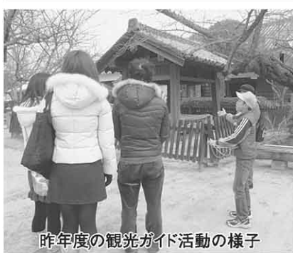
昨年度の観光ガイド活動の様子

松山を訪れる観光客へのイメージアップを図ろうと、タクシー乗務員を対象に「タクシー乗務員観光おもてなし研修2010」を10月27・28日に総合コミュニティセンターで開催。2日間で約1,000人が参加し、交通マナーやおもてなしの接客技術などを学びました。