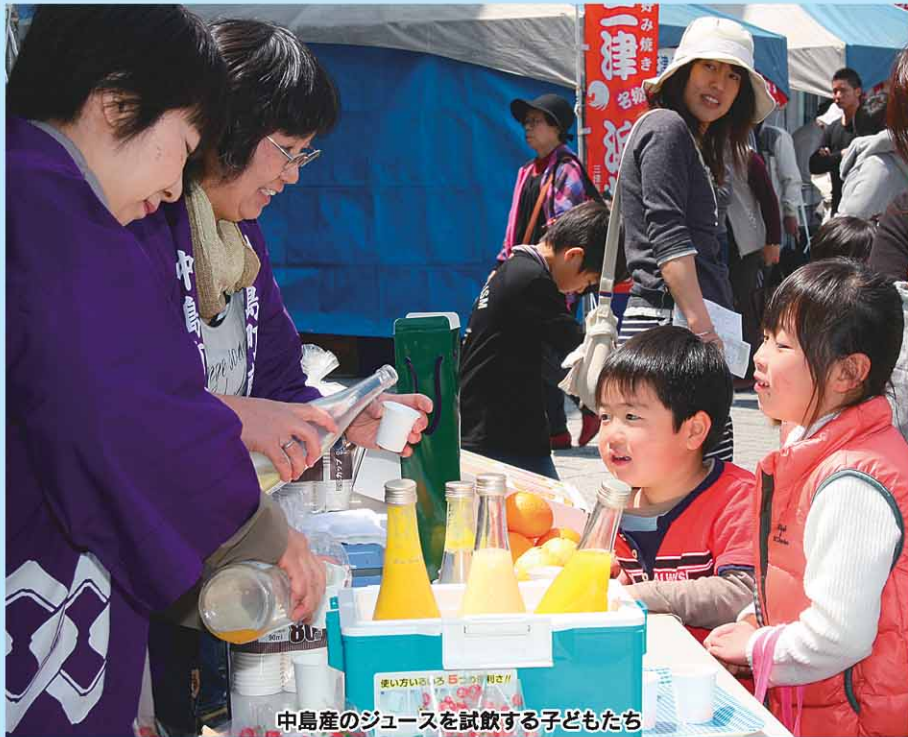
中島産のジュースを試飲する子どもたち