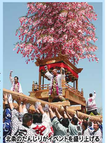
北条のだんじりがイベントを盛り上げる

期間中、興居島、釣島、野那島、中島、睦月島、津和島、二神島、安居島、鹿島の10島と三津浜・高浜・北条港周辺で多彩な催しを繰り広げます。