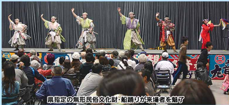
県指定の無形民俗文化財・船踊りが来場者を魅了

発行：松山市役所／編集・総合政策部広報課／毎月1日・15日 ☎948-6705・FAX 934-2578・HP http://www.city.matsuyama.ehime.jp/