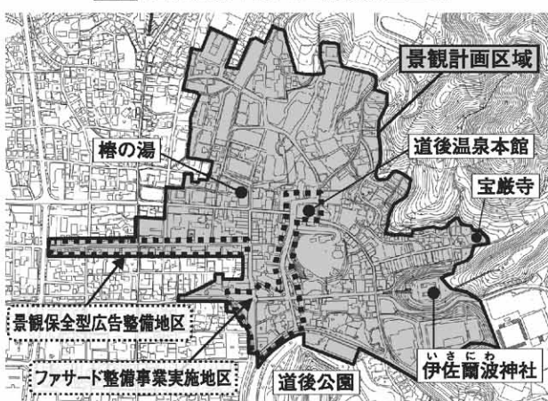
図2 道後温泉本館周辺景観計画区域

【届け出が必要な行為】 ●建築物の建築など・工作物の建設など ●土地の形質の変更・木竹の伐採 ●屋外における物件の堆積 届け出から30日間は、行為の着手が制限されます