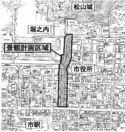
図1 市役所前榎町通り景観計画区域

市民・事業者・行政が協働して松山らしい景観を守り育てるため、景観法に基づき松山市景観計画を策定しました。適用は6月1日からです。