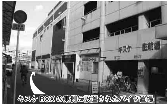
キスケBOXの東側に設置されたバイク置場

JR松山駅周辺の駐車環境改善のため、バイク(50CCを含む)の無料駐車場を変更します。ご注意ください。 左下図の1、2、3、4からキスケBOXバイク置場(宮田町5-9へキスケBOX東側)