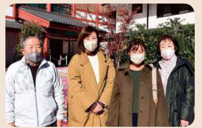
親子三代で広島から観光に来たご家族

以前来たときは、まだ飛鳥乃湯泉はなく、今回初めて見ました。とてもきれいですてきです。