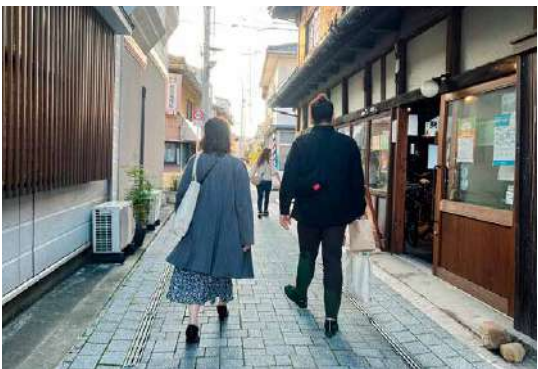
三津浜を散策するツアー参加者