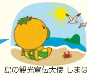
島の観光宣伝大使しまぼう

「里島めぐり」は島しょ部を活性化するため「まつやま里島ツーリズム連絡協議会」の会員が実施している体験・イベントです。