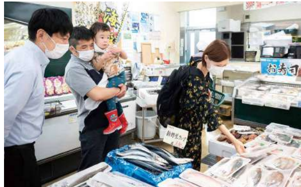
産直市で新鮮な魚を手取るツアー参加者

参加者から「移住が具体的に、仕事を考え直すきっかけにもなり、本当にいいツアーだった」などの声を頂きました。