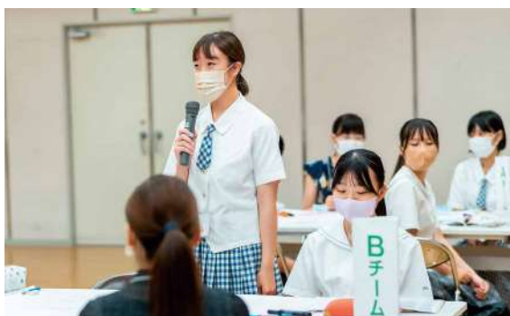
マツワカミーティングで地元メーカーに若者目線で提案

去年7月、学生を中心にプロジェクトチーム「第4期マツワカ」を結成しました。地元で活躍する先輩取材するほか、若者に人気の店舗や話題のスポットをウェブサイトで紹介。また、地元メーカーの課題を聞き、新商品を提案し、販売を促す手法を話し合っています。これからも、若者世代の松山ファンを増やすための魅力を発信します。