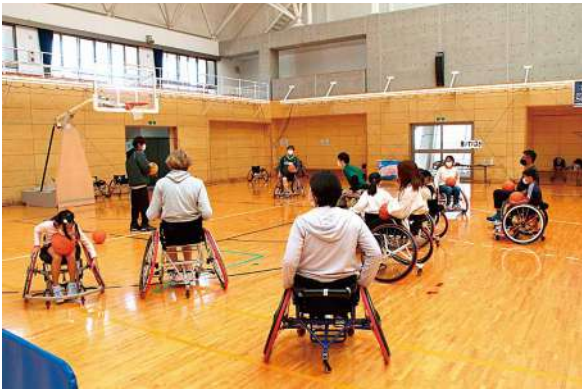
身体障がい者スポーツ交流大会・体験会に活用

株式会社フライングデックスから、令和4年11月30日、企業版ふるさと納税制度を活用して、スポーツインングシティまつやま推進事業に寄付を頂きました。 企業版ふるさと納税は、地方公共団体が行う地方創生の取り組みに企業が寄付をした場合に、税制上の優遇措置が受けられる制度で、本社が所在しない地方公共団体への寄付が対象です。 本市は、この制度を積極的に活用し、企業の皆さんに賛同いただける魅力ある取り組みを進めます。