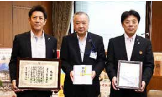
(左から) 大塩支社長、藤田副市長、岩井副支社長