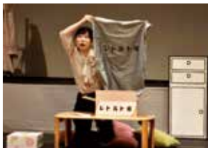
7月公演「レトルト彼」

上映作品『月光キネマ』(第18回大賞)、『オトナバー』(第15回ショートショート部門大賞)、『はるのうた』(第15回ショートショート部門子規・漱石特別賞)