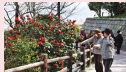
松山総合公園「椿園」

市内では、庭木や盆栽のほか、神社や寺、公園、学校や公民館など、至る所でツバキが目にとまります。人と自然の触れ合いの場として、多くの人に親しまれている松山総合公園。その一角にある「椿園」には、日本種300種、洋種200種のツバキがあり、愛媛や松山にゆかりの珍しい品種も植えられています。見ごろを迎える2・3月には、専門家と一緒に散策し、育て方の講習が受けられるイベント「椿園を歩こう!-園芸教室-」も開催します。ぜひ足を運んでみてください。