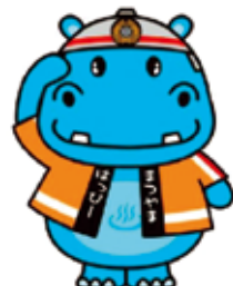
市消防局 マスコットキャラクター はっぴーカバー君

☎火災 = (消) 予防課 ☎926-9247 ・ FAX 926-9163 救急 = (消) 警防課 ☎926-9227 ・ FAX 926-9188