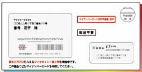
国が送付する封筒