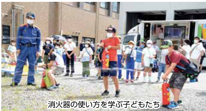
消火器の使い方を学ぶ子どもたち

松山市では、地震や風水害、火災などに備え、防災力をさらに高めるため、今後、子どもから高齢者まで、全世代に切れ目のない防災教育を進めます。