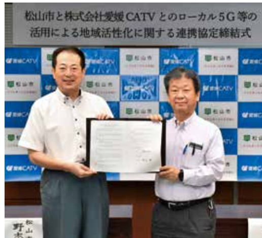
図システム管理課 ☎948 6243・FAX 934 1810