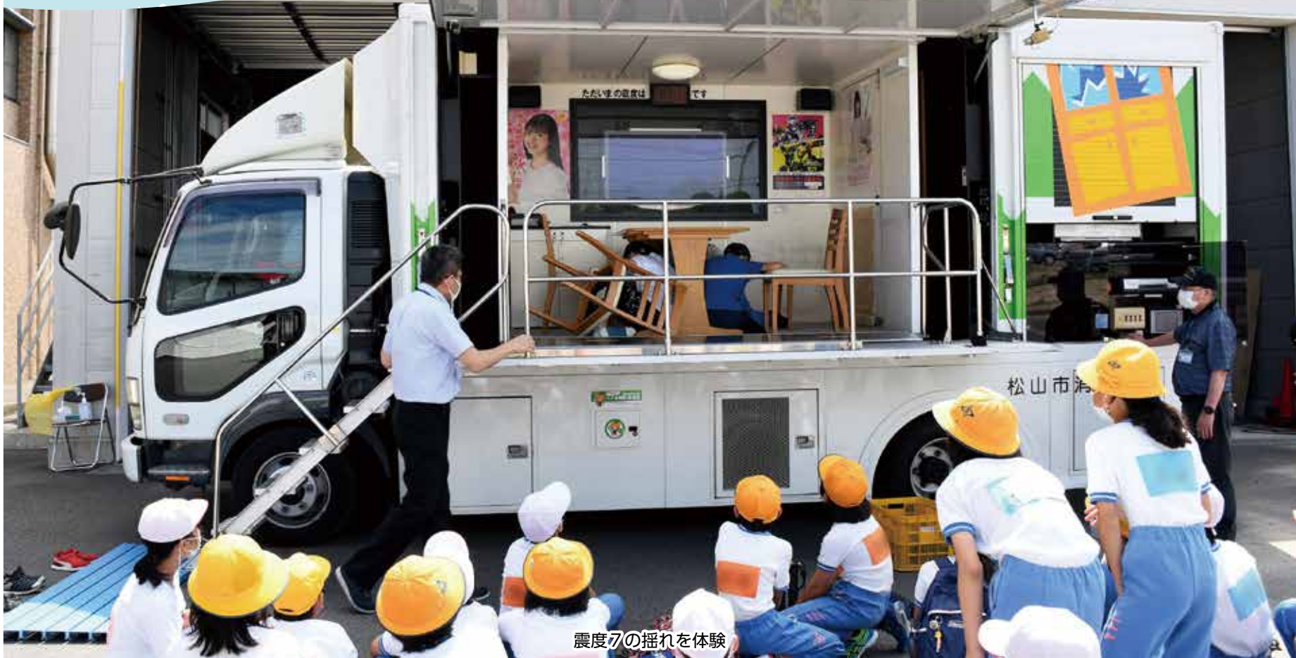
震度7の揺れを体験