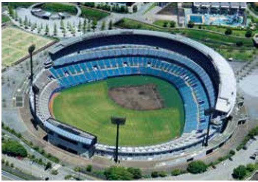
図スポーツイングシティ推進課 ☎948 6889・FAX 934 1287