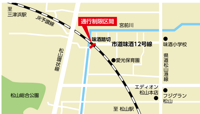
図県中予地方局建設部鉄道高架課(工事・通行に関すること) ☎909-8777・FAX 921-4990 都市生活サービス課 ☎948-6975・FAX 934-5862