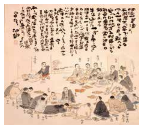
下村為山画東碧梧桐賛「俳句革新記念子規庵句会写生図」

今回の特別企画展では、句会稿や参加者たちの記録など子規の句会関係の資料を展示し、俳句革新の原動力ともなった子規の句会の実態に迫ります。