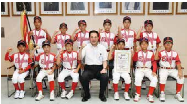
図スポーツイングシティ推進課 ☎948 6226・FAX 934 1287