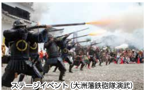
ステージイベント(大洲藩鉄砲隊演武)