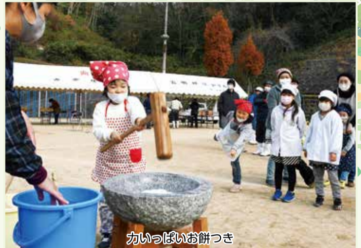
かっぱいお餅つき