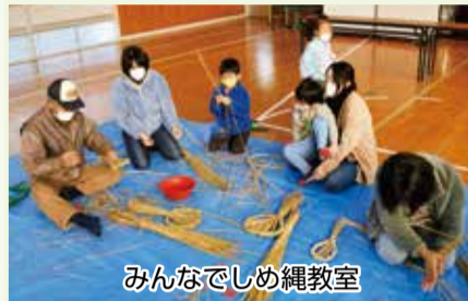
みんなでしめ縄教室