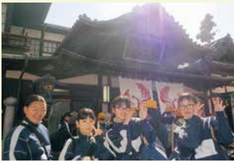
道後温泉本館(西面)前

道後にはたくさん観光地があります。そこで私たちは、「観光のまち」といわれる道後で一番の観光地がどこなのか調べました。道後に訪れた観光客50人にアンケートをした結果、やはり道後温泉が27票と他の観光地に圧倒的な差をつけ1位になりました。