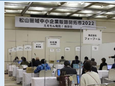
松山圏域中小企業販路開拓市