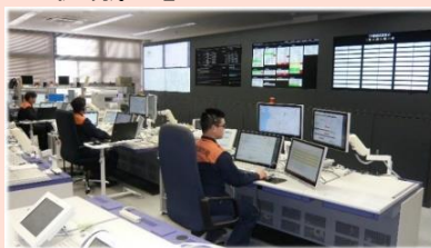
松山市消防指令センター