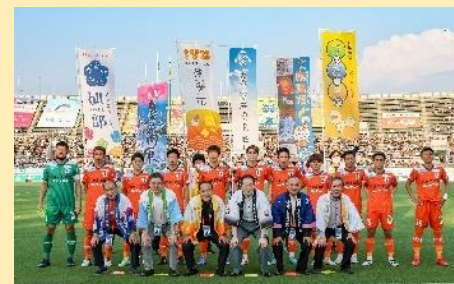
愛媛FC「松山広域デー」