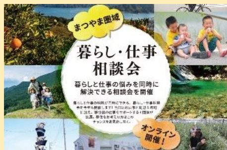
暮らし・仕事相談会