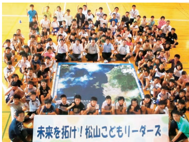
松山子どもリーダーズ事業の様子