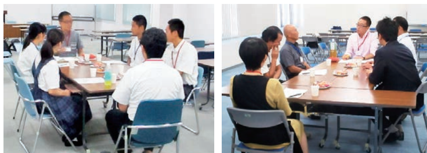
グループインタビューの様子