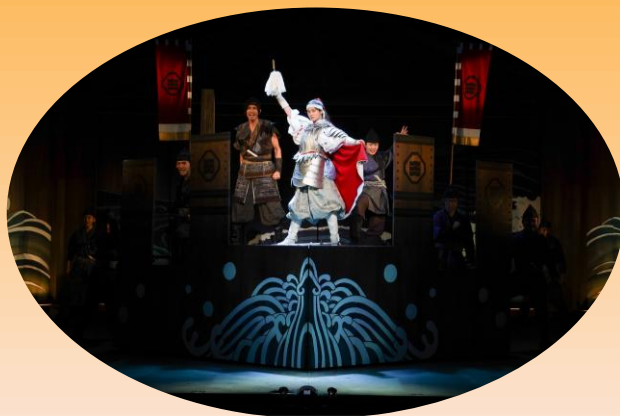
坊っちゃん劇場（東温市）