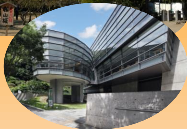
坂の上の雲ミュージアム（松山市）