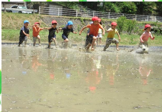
五明小学校の児童と泥んこ遊び