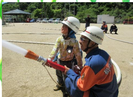
五明地区防災訓練