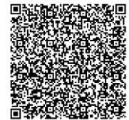
松山市ファミリーシップ制度 電子申請サイト