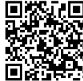
ぴったりサービス 動作環境確認サイト