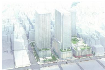
日本橋二丁目地区（東京都中央区） 容積率：800%、700% → 1990% 等

都市再生に貢献し土地の高度利用を図るため、都市再生緊急整備地域内において、既存の用途地域等に基づく規制にとらわれず自由度の高い計画を定めることにより、容積率制限の緩和等が可能。