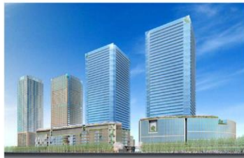
大阪駅北地区（大阪市） 容積率：800% → 1600% 等

都市再生緊急整備地域内における都市再生特別地区の都市計画に位置づけることで、道路の付け替え、廃道をせずに、道路上空に建築物を建てる事が可能。