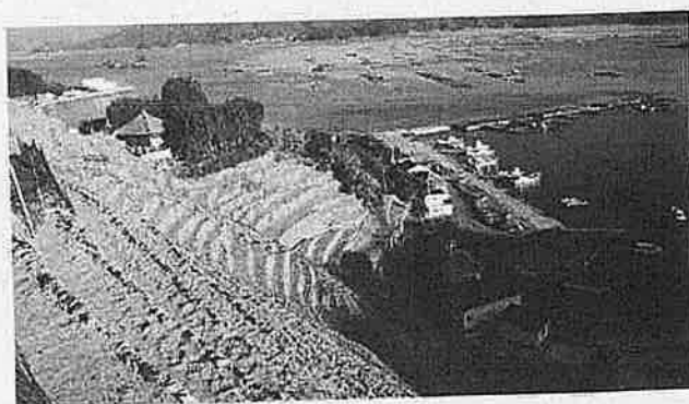
宇和島水荷浦の段畑