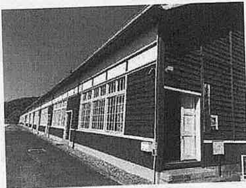
宇和米博物館外観

「宇和米博物館」は、旧宇和町小学校校舎を利用しており、各教室に色々な種類のお米・稲の標本や各種農器具が展示されていました。また、余った教室を事務所として、貸し出していました。また、「歴史文化博物館」では南予の歴史を学びました。