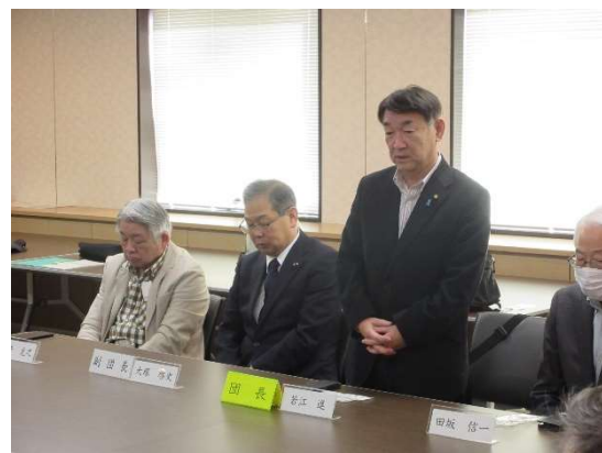
(若江団長あいさつ)