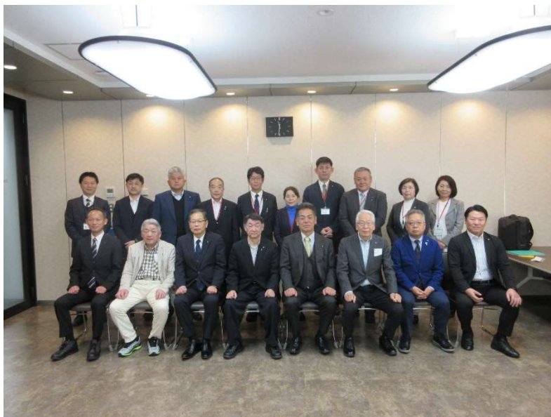
(議長と視察派遣者一同)