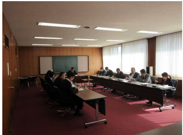
(打ち合わせ会の様子)