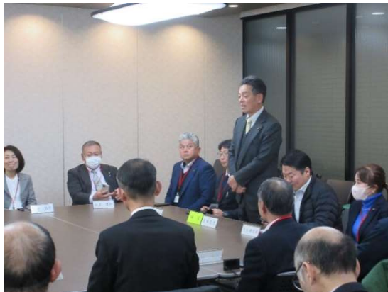
(渡部議長あいさつ)