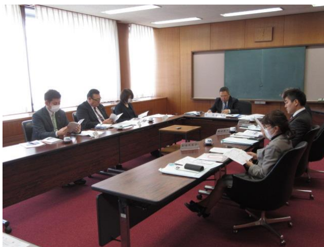
(打ち合わせ会の様子)