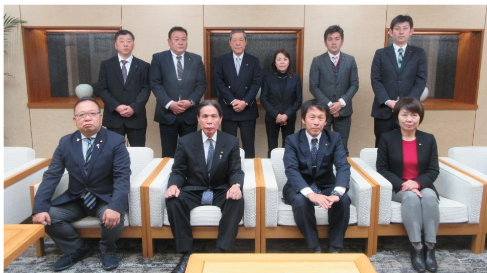
(正副議長と視察派遣者一同)