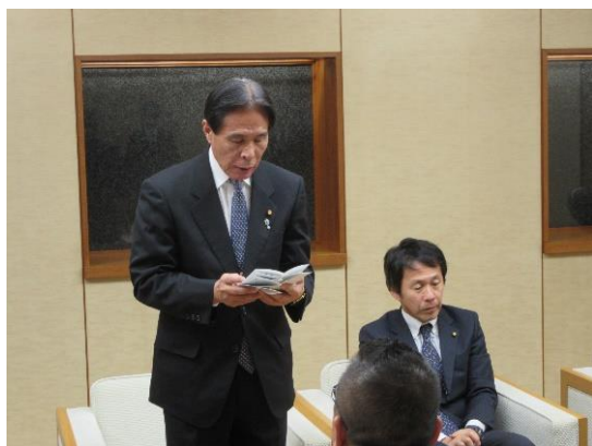
(清水議長あいさつ)