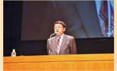
片山善博氏による基調講演