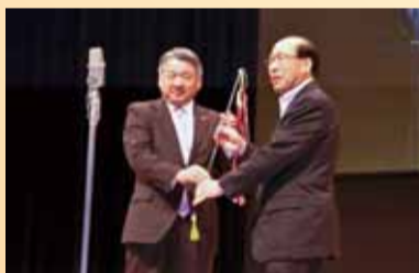
次期開催地の旭川市議会議長へ 開催旗が引き継がれました