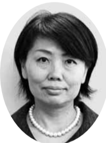
長野 昌子 議員 (公明党議員団)