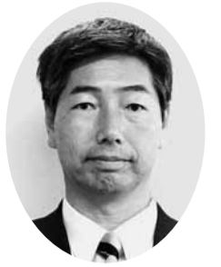
山瀬 忠吉 議員 (公明党議員団)