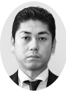
川本 健太 議員 (自由民主党議員団)

答 1期目では、笑顔が生み出す新たな活力や賑わいを改めて実感した4年間であった。そこで2期目では、笑顔の先にある幸せを目標に「健康(健康)・賑幸(賑幸)・二幸共(二幸共)の3つのテーマを設定しており、さまざまなライフステージで笑顔にあふれ幸せを実感できる都市になるよう、引き続き全力で取り組んでいく。