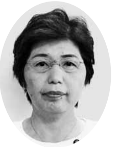
清水 尚美 議員 (公明党議員団)