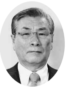
森岡 功 議員 (松山維新の会)

答 制度廃止に伴う案内を広報紙に掲載するほか、各支所などへポスターを掲示し広く市民へ周知するとともに、現在加入されている方には別途個別にお知らせする。また、希望者には民間の保険をご案内するなど、丁寧な対応に努めていきたいと考えている。