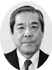
土井田 学 議員 (自由民主党議員団)