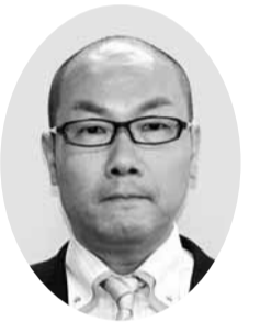
太田 幸伸 議員 (公明党議員団)