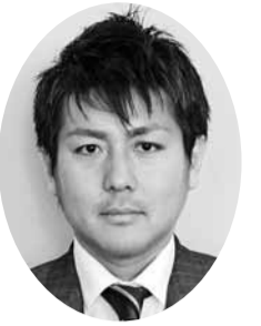
岡田 教人 議員 (自由民主党議員団)