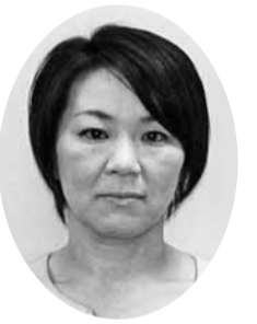
杉村 千栄 議員 (日本共産党議員団)