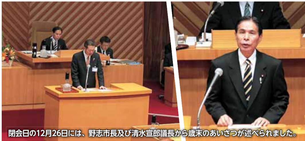
閉会日の12月26日には、野志市長及び清水宣郎議長から歳末のあいさつが述べられました。