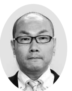
太田 幸伸 議員 (公明党議員団)

答 本市における「行政責任」とは、松山市第6次総合計画に掲げる将来都市像「一人が笑い顔広がる幸せ実感都市まつやま」の実現に向けて、限られた財源や人員を最大限活用し、さまざまな行政需要や市民ニーズに適切かつ柔軟に対応することであると考えている。 答 本市の主な水源は「毎年の税金を投入することとなり、多大な行政責任が生じるのである」と強い危機感を覚える。そこで、本市が黒瀬ダムからの分水事業を見直さない理由を伺う。 答 本市の主な水源は「毎年の税金を投入することとなり、多大な行政責任が生じるのである」と強い危機感を覚える。そこで、本市が黒瀬ダムからの分水事業を見直さない理由を伺う。