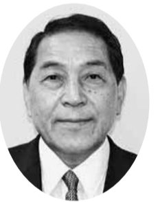
丹生谷 利和 議員 (公明党議員団)

今年9月18日の県議会本会議で中村知事から、乳幼児医療費助成の本市への補助率引き上げを検討したいとの答弁があった。今後は県の考え方を伺い、確保できる財源規模を精査した上で、入院費助成の対象を中学3年生まで拡大することも視野に入れ、対象の拡大範囲と実施時期について早急に検討を行いたいと考えている。