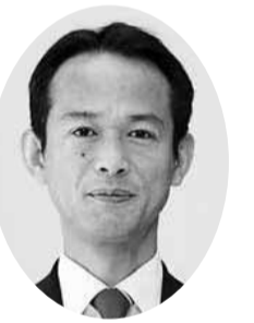
吉富 健一 議員 (公明党議員団)