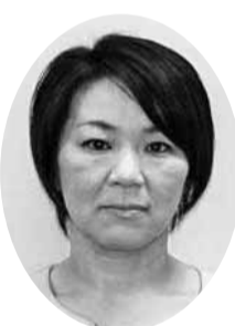
杉村 千栄 議員 (日本共産党議員団)