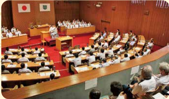
60名近い方にご来場いただき、傍聴席はほぼ満席となりました