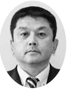
白石 勇二 議員 (自由民主党議員団)