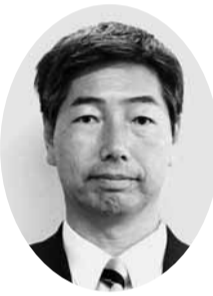
山瀬 忠吉 議員 (公明党議員団)