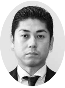
川本 健太 議員 (自由民主党議員団)

答 平成27年4月からの工事着手に向けて設計に取り組みしており、整備のメインコンセプトを「学校・人・活動・地域・自然との出会いと学びを生むコミュニティ・イン・スクール」とし、機能的で柔軟性のある環境整備を行うこととしている。また、ワークショップを通じて子ども自身が計画に関わることで、より充実した学校になり、母校への愛着を高められると考えている。