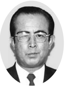
白石 研策 議員 (自由民主党議員団)