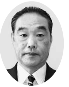
角田 敏郎 議員 (自由民主党議員団)