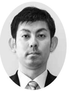
岡 雄也 議員 (自由民主党議員団)

答 本市では、今年度から、シブカフェ愛ワークが主催する「ヒトカフエ」や「プロシフト」に参画し、若者の定着度が高い中小企業の方策を研究し、中小企業全体に周知している。また、松山市地域雇用創造協議会において開