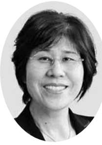
小崎 愛子 議員 (日本共産党議員団)