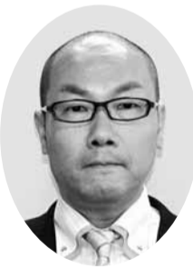
太田 幸伸 議員 (公明党議員団)