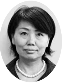
長野 昌子 議員 (公明党議員団)