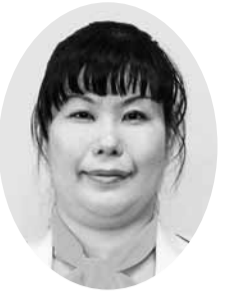
池田 美恵 議員 (民主連合)