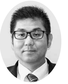
本田 精志 議員 (自由民主党議員団)