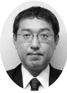
中村 嘉孝 議員 (社民党議員)

答 これまで「だから、ことば大募集!!」や「子規のいる街」シンポジウムなど市民のこころを愛する心を街全体を使って表現するさまざまな事業を進めてきた。今後さらに磨きをかけ、松山といえは「ことば」と認知してもらえよう、全国に向けてことばのまち松山を発信していきたい。