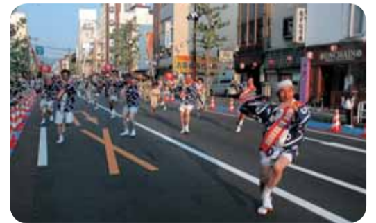
松山まつりの様子

松山市観光振興議員連盟として第48回松山まつりの「野球拳おどり」(団体連の部・無審査連の部)に参加し、本連盟の活動を知っていただくとともに、イベントを盛り上げ、松山まつりの魅力を発信しました。