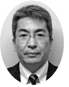
武田 浩一 議員 (民社クラブ)