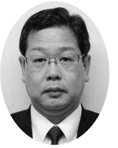
大塚 啓史 議員 (公明党議員団)