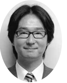
宮内 智矢 議員 (共産党議員団)