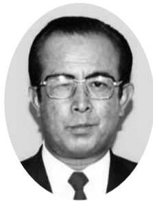
白石 研策 議員 (自由民主党議員団)