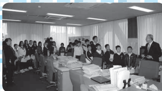
議会内施設を見学