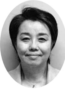
篠崎 英代 議員 (ネットワーク市民の窓)