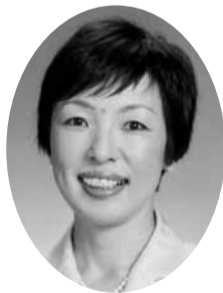
武井 多佳子 議員 (ネットワーク市民の窓)