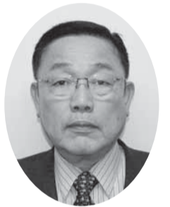
友近 正 議員 (無党派)