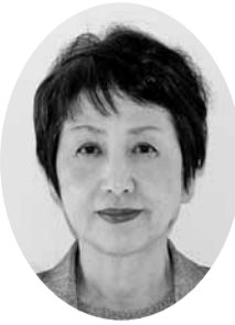
藤本 公子 議員 (公明党議員団)

答 市民との直接対話を通じ、市民と行政相互の理解を進め、市民目線での市政運営を図るといふ所期の目標は一定達成できたと考えている。今後、一人でも多くの人を笑顔にするため、さらに地域の声を深く掘り下げ、市政に生かす必要があることから、二巡目においては、一巡