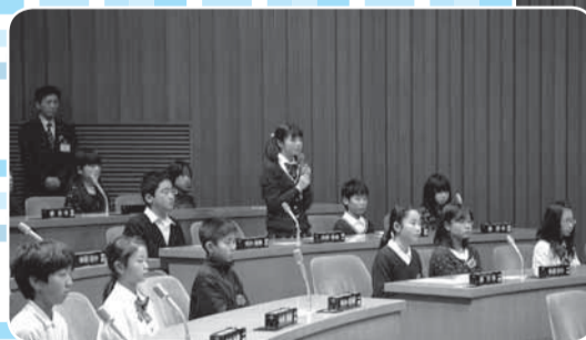
意見交換会で議員に質問

また、本市議員との意見交換会では、「市の借金はいくらぐらいあるのか」「議員になるためにはどんな勉強をしたらよいか」「議員にとって仕事のやりがいとはなにか」といった質問が児童から積極的に出され、小学生ならではの意見を聞くことができました。