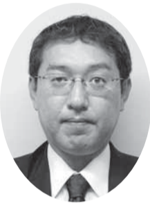
中村 嘉孝 議員 (社民党議員)

(本市の交通安全対策、水道事業の震災対策、本市の交通安全対策、水道事業の震災対策)