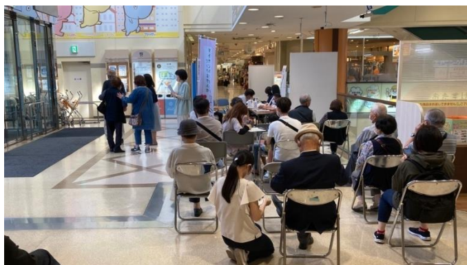
5月のフジグラン松山に設けた臨時窓口