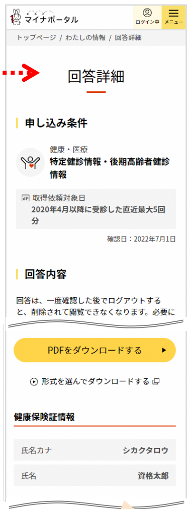
健康保険証情報を表示 PDFをダウンロード可能