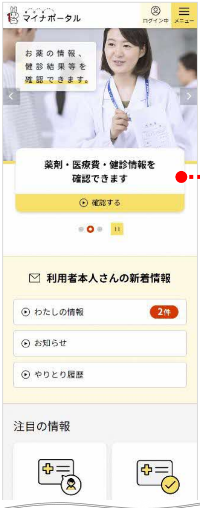
マイナポータルにログイン トップバナーの表示を選択