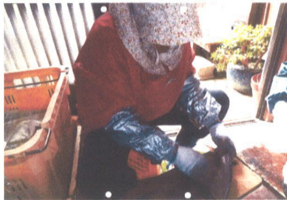
水産物加工品のイベント販売