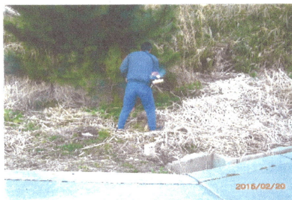
植樹・魚つき林の整備