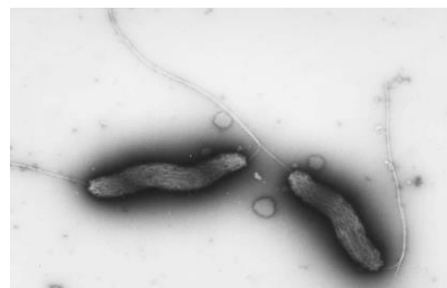
カンピロバクターの電子顕微鏡写真