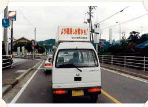
公用車での節水呼び掛け