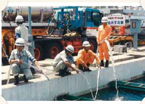
多方面からの支援の水