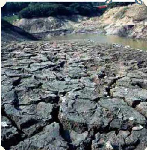
水が干上がり、ひび割れたダム底