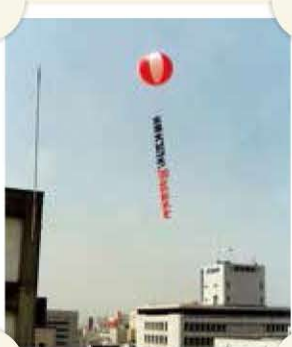
バルーンでの節水呼び掛け

平成6年の夏は猛暑、しかも梅雨期間が短く少雨の梅雨になったため、西日本各地で深刻な水不足になり、松山市民も大変つらい思いをしました。