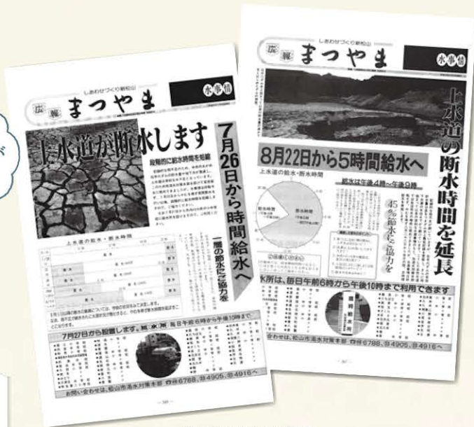
広報まつやまの号外