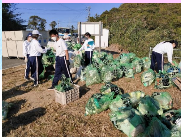
松山北高校 「愛顔グローバル部愛Landまつやま」

興居島をはじめとした島しょ部で、海岸清掃と環境保全意識の向上に取り組むメンバーです！