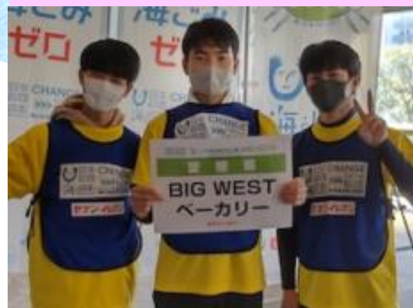
愛媛大学附属高校 「BIG WEST ベーカリー」

愛媛代表として2年連続出場した「スポGOMI 甲子園」では、2021優勝&2022準優勝！