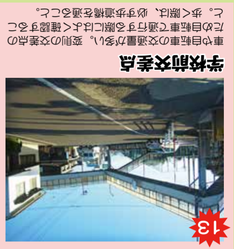
原種田橋前の交差点