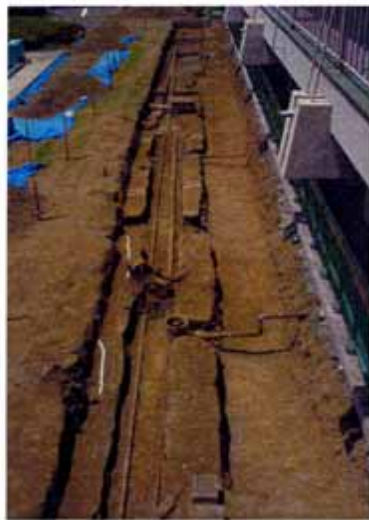
2次調査水田畦畔検出状況(東から)