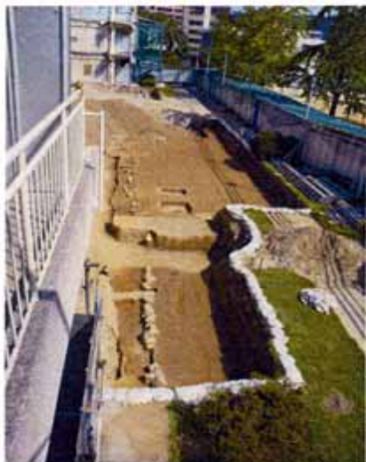
1次調査下層水田完掘状況(西から)