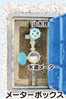
メーターボックス