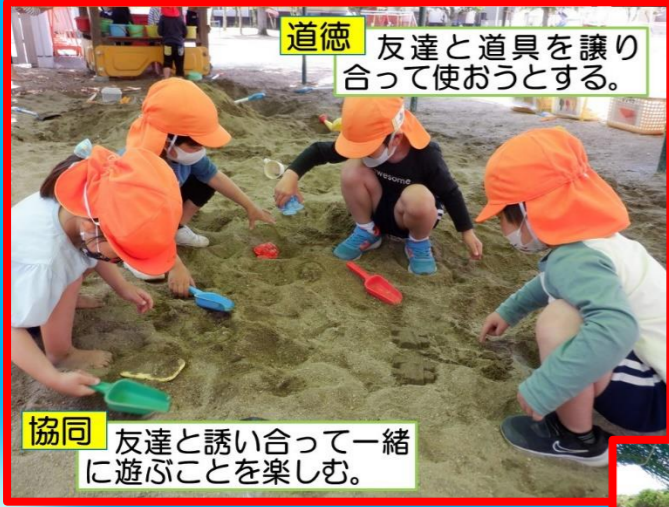
道徳 友達と道具を譲り合って使おうとする。