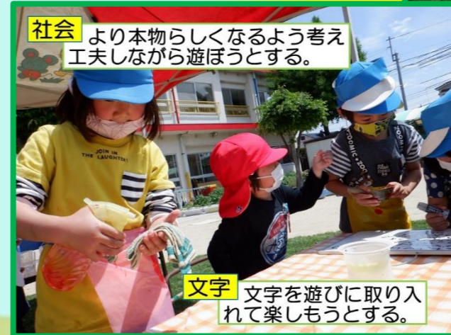
社会 より本物らしくなるよう考え工夫しながら遊ぼうとする。