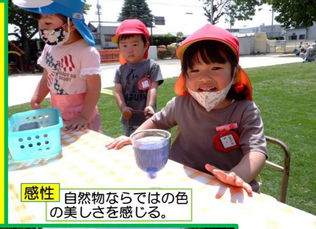
感性 自然物ならではの色の美しさを感じる。