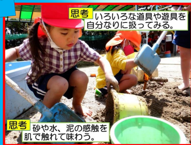
思考 いろいろな道具や遊具を自分なりに扱ってみる。