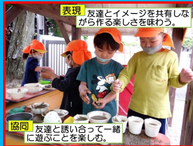
表現 友達とイメージを共有しながら作る楽しさを味わう。