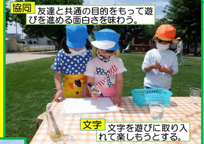
協同 友達と共通の目的をもって遊びを進める面白さを味わう。