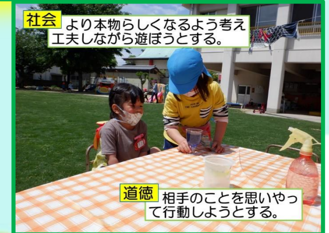
社会 より本物らしくなるよう考え工夫しながら遊ぼうとする。