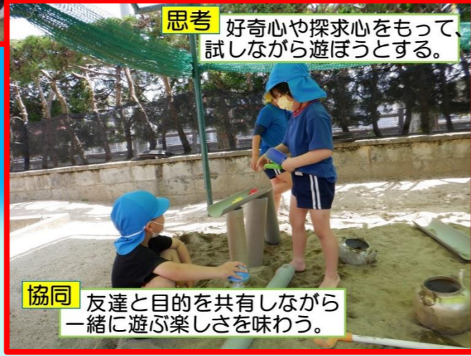
思考 好奇心や探求心をもって、試しながら遊ぼうとする。