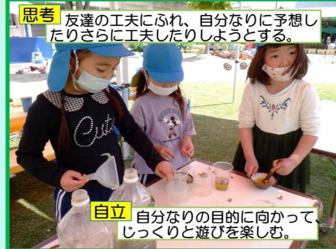
思考 友達の工夫にふれ、自分なりに予想したりさらに工夫したりしようとする。