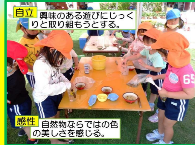
自立 興味のある遊びにじっくりと取り組もうとする。