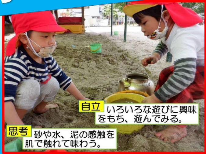
自立 いろいろな遊びに興味をもち、遊んでみる。