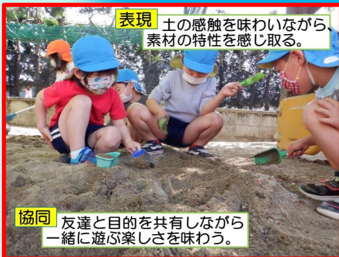
表現 土の感触を味わいながら、素材の特性を感じ取る。