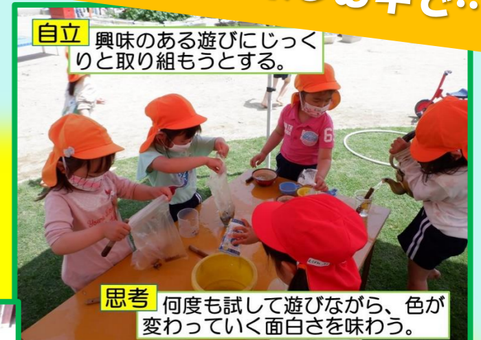
自立 興味のある遊びにじっくりと取り組もうとする。