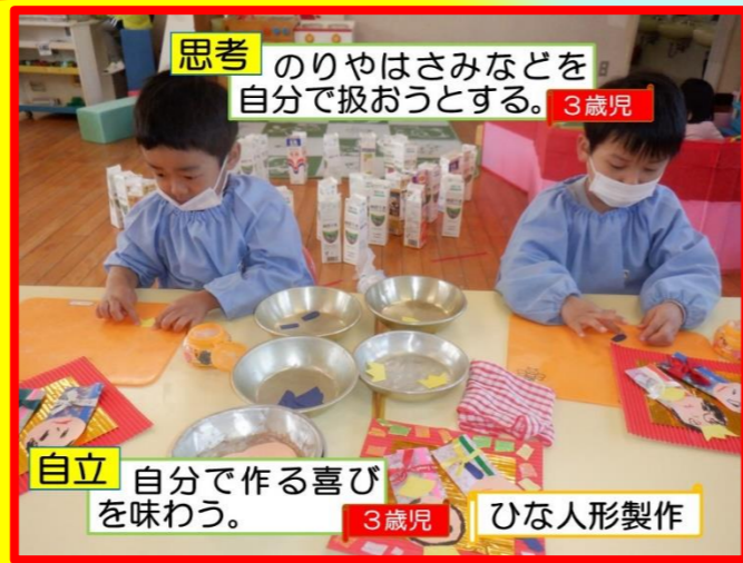
思考 のりやはさみなどを自分で扱おうとする。3歳児