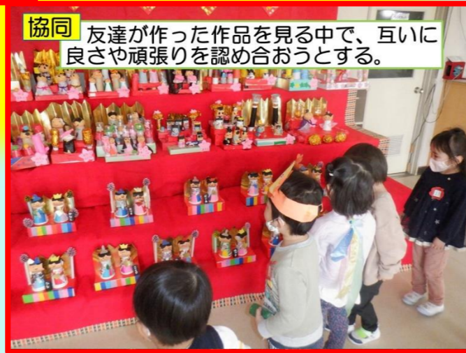
協同 友達が作った作品を見る中で、互いに良さや頑張り認め合おうとする。