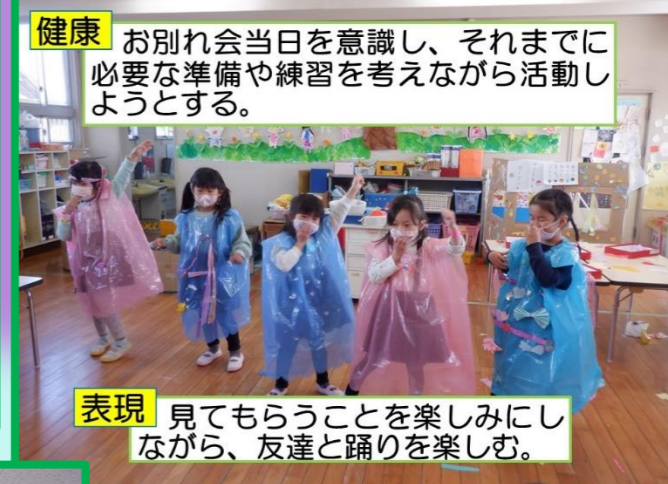
健康 お別れ会当日を意識し、それまでに必要な準備や練習を考えながら活動しようとする。