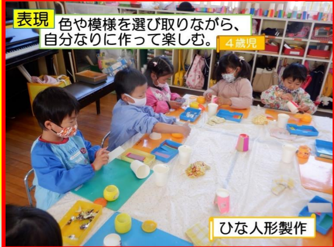
表現 色や模様を選び取りながら、自分なりに作って楽しむ。4歳児