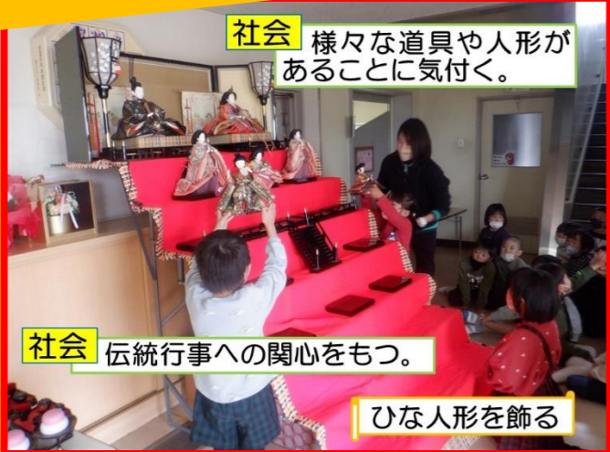
社会 様々な道具や人形があることに気付く。