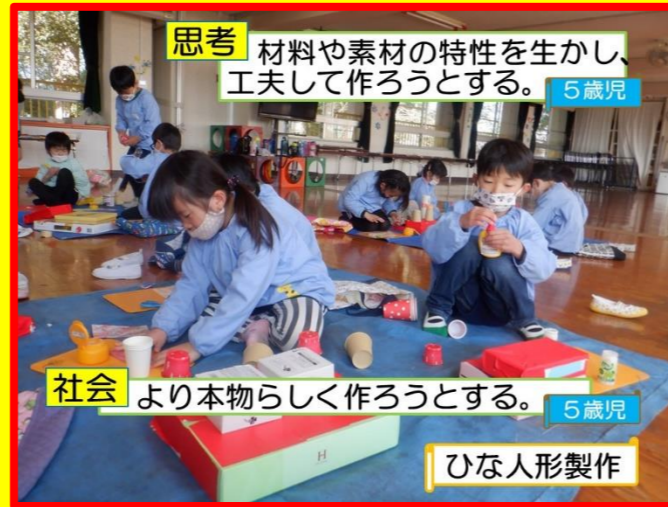
思考 材料や素材の特性を生かし、工夫して作ろうとする。5歳児