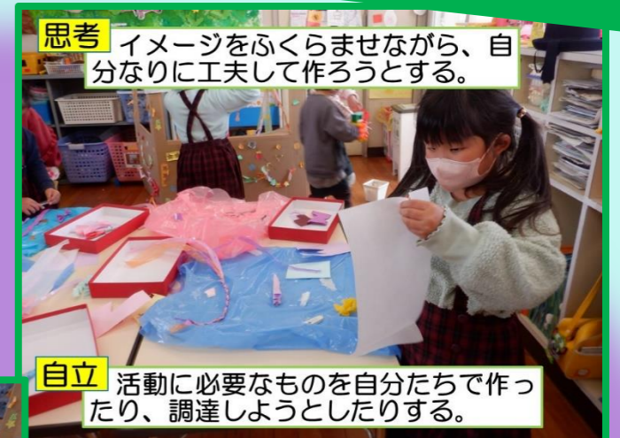
思考 イメージをふくらませながら、自分なりに工夫して作ろうとする。