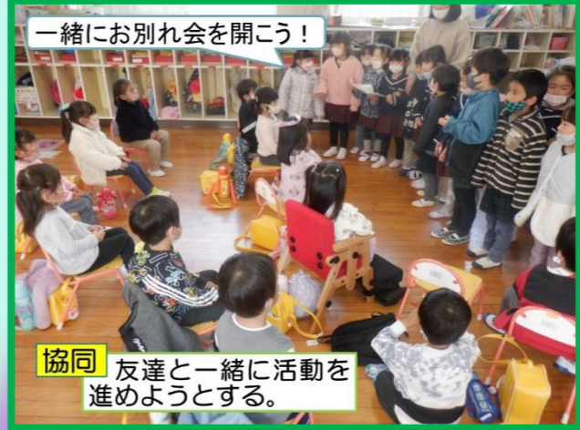
一緒にお別れ会を開こう!