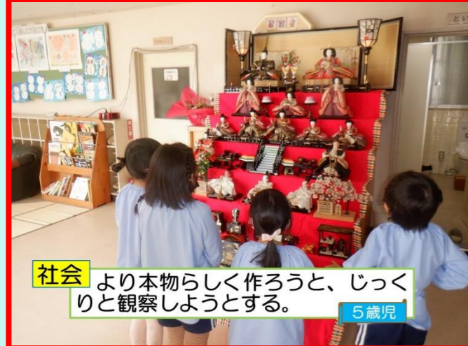
社会 より本物らしく作ろうと、じっくりと観察しようとする。5歳児