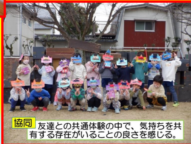
5歳児が作った鬼ヶ島で遊ばせてもらう