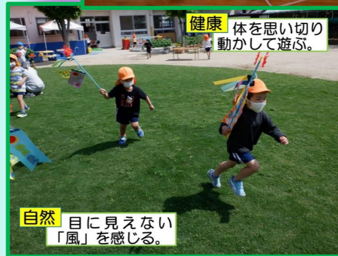
健康 体を思い切り動かして遊ぶ。