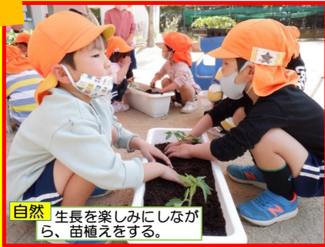
自然 生長を楽しみにしながら、苗植えをする。