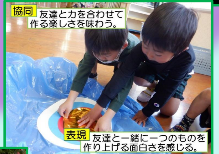
協同 友達と力を合わせて作る楽しさを味わう。