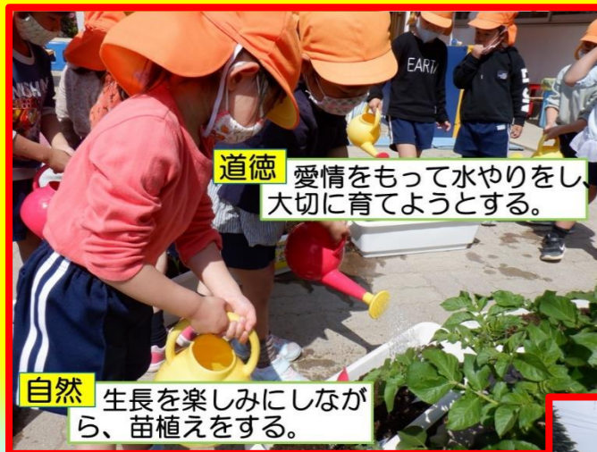
道徳 愛情をもって水やりをし、大切に育てようとする。