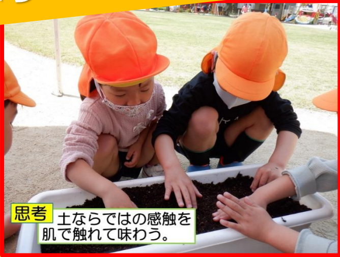
思考 土ならではの感触を肌で触れて味わう。