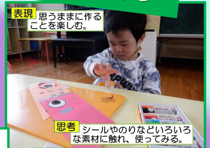
表現 思うままに作ることを楽しむ。