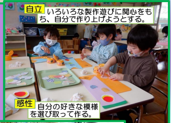
自立 いろいろな製作遊びに関心をもち、自分で作り上げようとする。