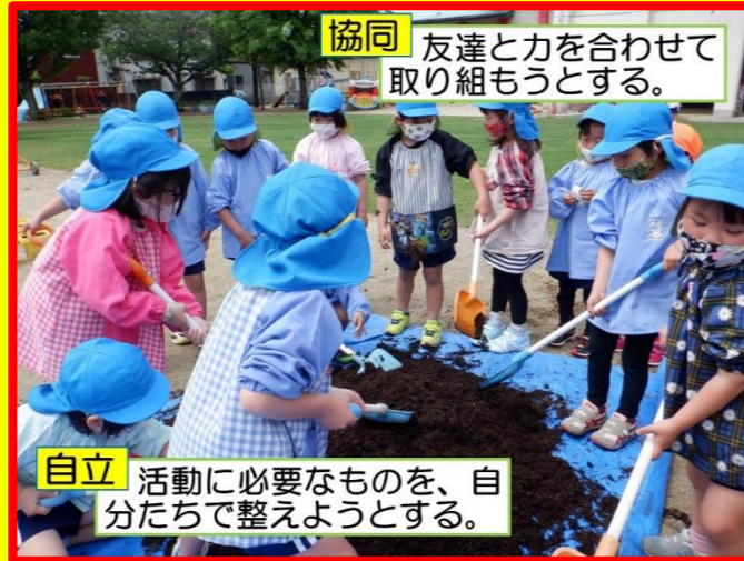
協同 友達と力を合わせて取り組もうとする。