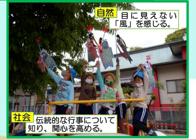
自然 目に見えない「風」を感じる。