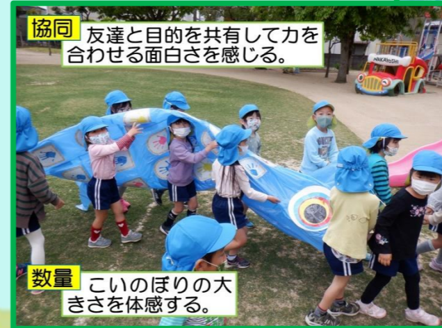
協同 友達と目的を共有して力を合わせる面白さを感じる。