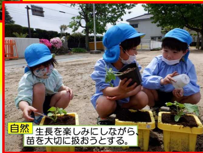
自然 生長を楽しみにしながら、苗を大切に扱おうとする。