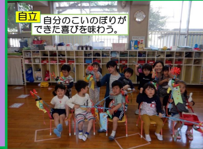
自立 自分のこいのぼりができた喜びを味わう。