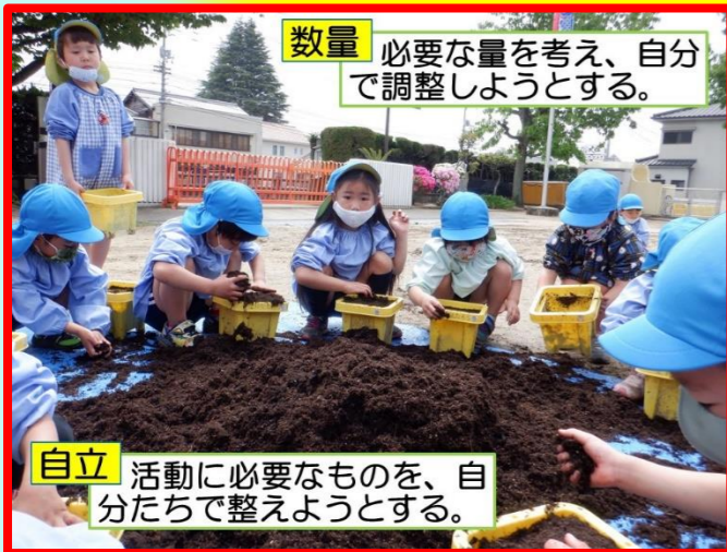
数量 必要な量を考え、自分で調整しようとする。