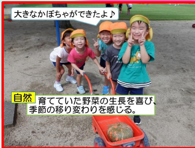
大きなかぼちゃができたよ♪