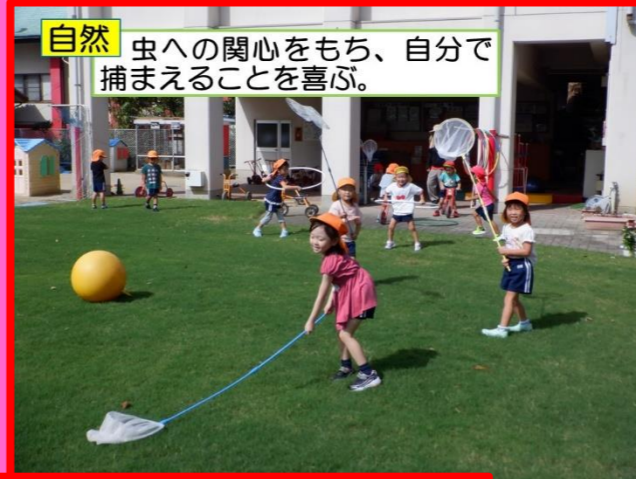
自然 虫への関心を持ち、自分で捕まえることを喜ぶ。