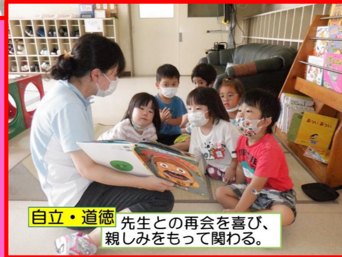
自立・道徳 先生との再会を喜び、親しみをもって関わる。