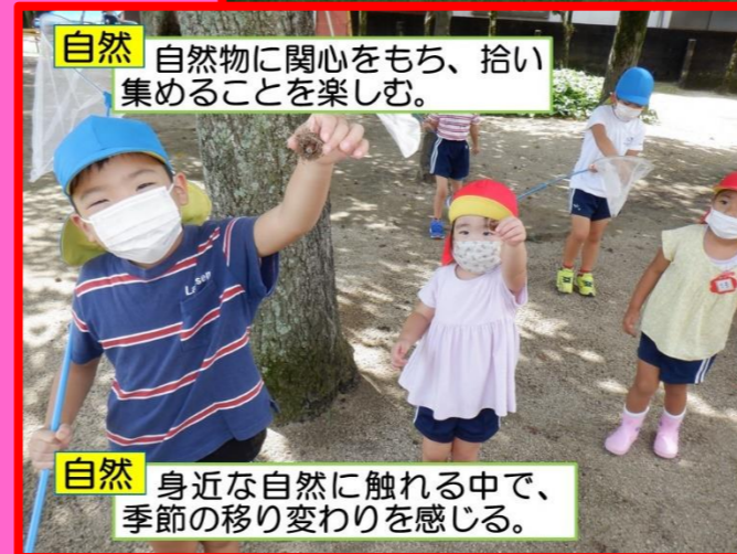
自然 自然物に関心を持ち、拾い集めることを楽しむ。