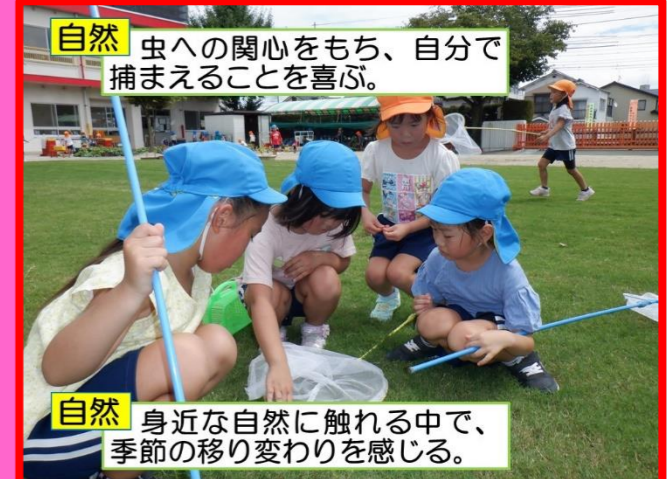
自然 虫への関心を持ち、自分で捕まえることを喜ぶ。