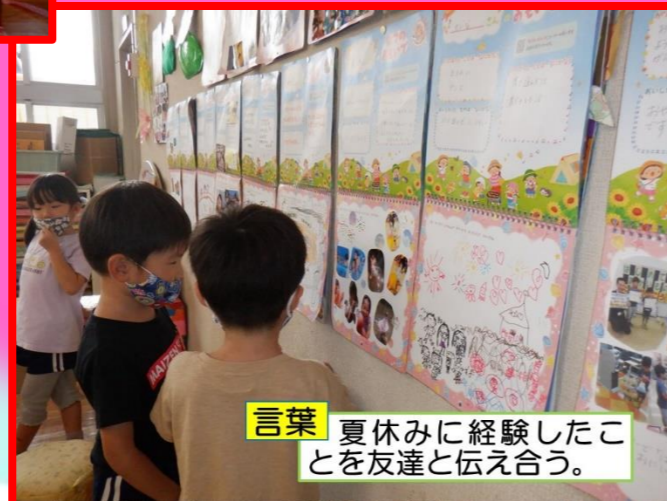
言葉 夏休みに経験したことを友達と伝え合う。