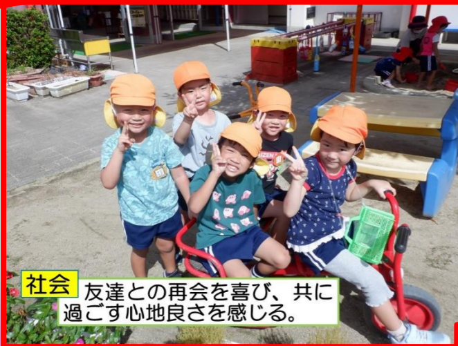
社会 友達との再会を喜び、共に過ごす心地良さを感じる。