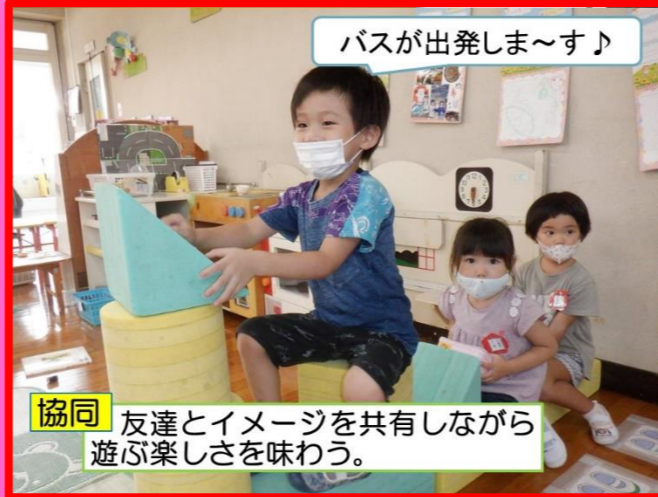
バスが出発しま〜す♪