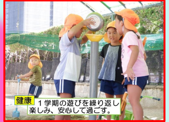
健康 1学期の遊びを繰り返し楽しみ、安心して過ごす。