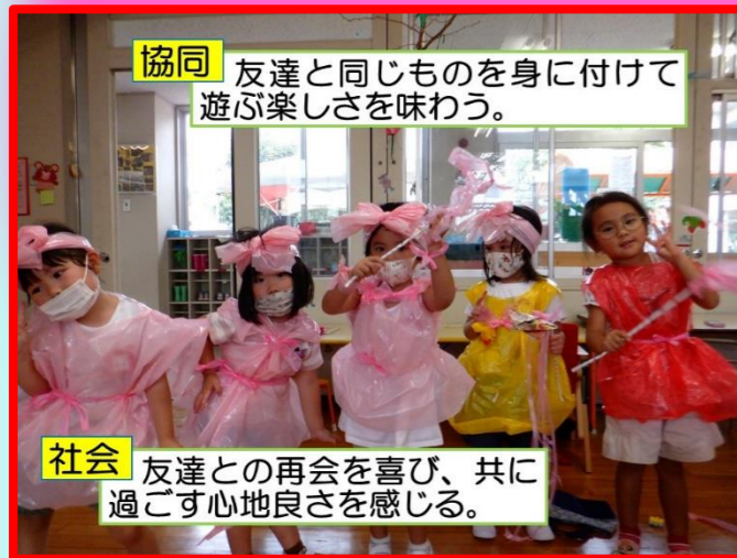
協同 友達と同じものを身に付けて遊ぶ楽しさを味わう。