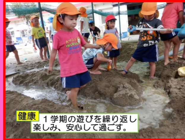
健康 1学期の遊びを繰り返し楽しみ、安心して過ごす。