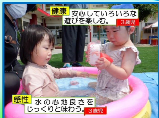
健康 安心していろいろな遊びを楽しむ。 3歳児