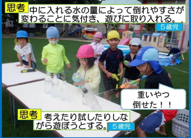
思考 中に入れる水の量によって倒れやすさが変わることに気づき、遊びに取り入れる。 5歳児