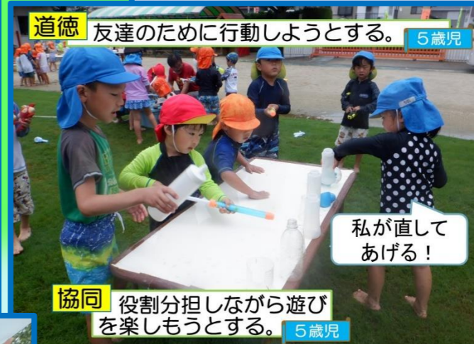
道徳 友達のために行動しようとする。 5歳児