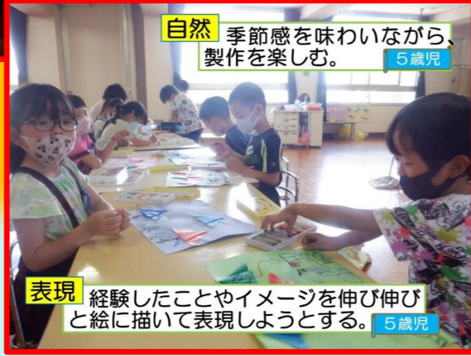
自然 季節感を味わいながら、製作を楽しむ。 5歳児