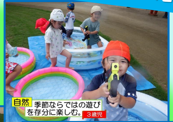
自然 季節ならではの遊びを存分に楽しむ。 3歳児