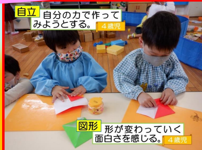
自立 自分の力で作ってみようとする。 4歳児