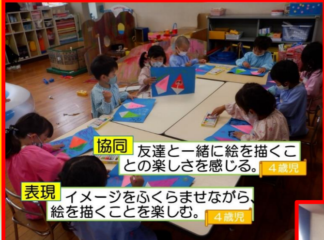
協同 友達と一緒に絵を描くことの楽しさを感じる。 4歳児