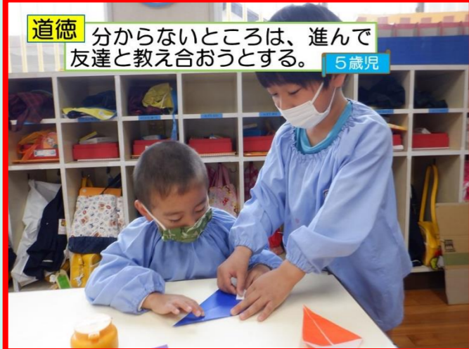
道徳 分からないところは、進んで友達と教え合おうとする。 5歳児