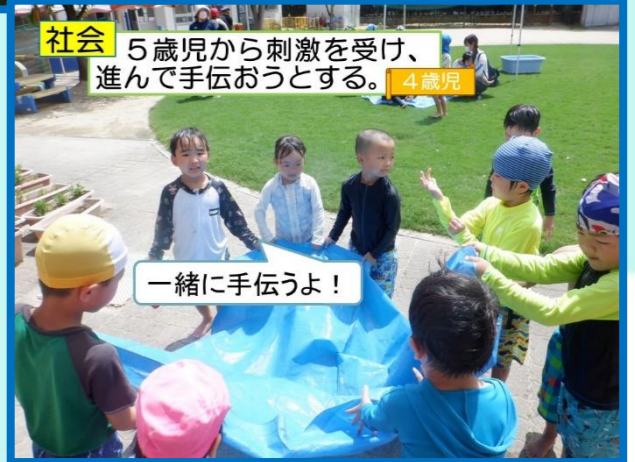
社会 5歳児から刺激を受け、進んで手伝おうとする。 4歳児