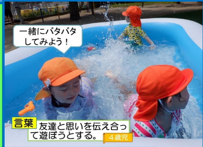
一緒にバタバタしてみよう!