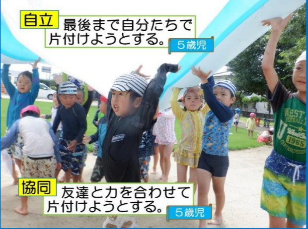
自立 最後まで自分たちで片付けようとする。 5歳児