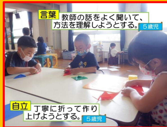
言葉 教師の話をよく聞いて、方法を理解しようとする。 5歳児