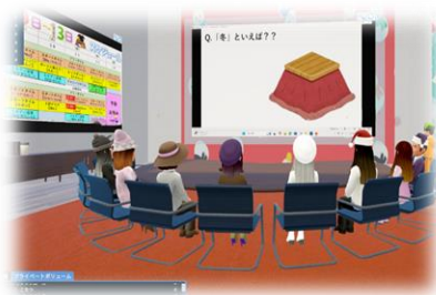
【子どもたちが話を聞く様子】

メタサポキャンパスは、「自宅から安心してつながられるあたたかい居場所」として、令和5年4月から運営を行っています。キャンパス内では、自主学習や自由参加型のイベント、共通のテーマに基づいた交流活動など、参加者が笑顔で元気になるような活動を実施しています。