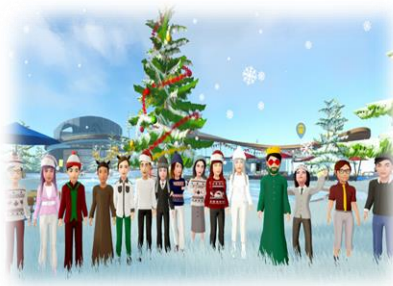
【クリスマスイベントの参加】