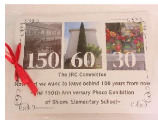
【イタリアへ送ったコスモスの種と記念写真展の冊子】