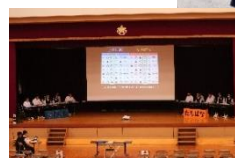
《校内ジュニア俳句甲子園の様子》