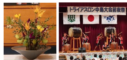
《個性を伸ばす日の様子》