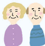
しんせき 家族、親戚の人