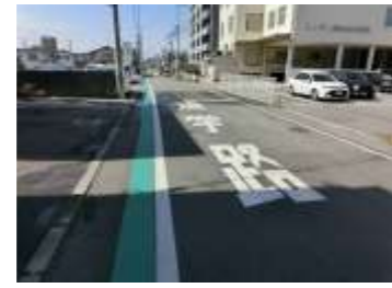
R2【NO. 2】 済