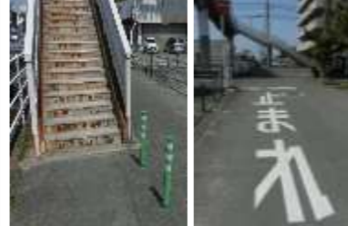
H29【NO. 5】 済

（状況） 歩道橋を下りた際、歩道橋がブロックとなり見通しが悪いので、自転車と接触する危険があります。また、止まれが薄くなっています。