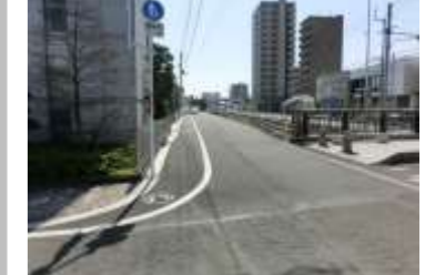
R2【NO. 1】 済