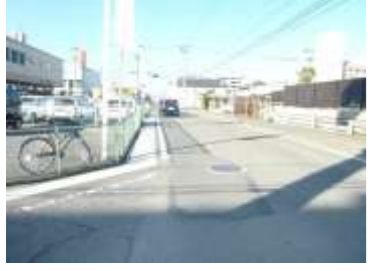
H29【NO. 3 H24-168】 済

（状況） 水路のある道路を通っているが、路側帯が狭く、信号待ちの車もいるため注意が必要です。