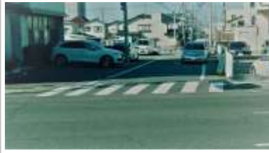
H29【NO. 1】 済