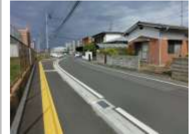
H29【NO. 6 H24-318】 済

（対策） カーブミラーを移設しました。避難所標識の移設を予定しています。路側帯の拡幅を検討します（学校からの連絡待ち）。