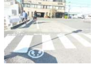
H29【NO. 2】 済

（状況） 信号のある横断歩道を横断する際、橋の上で待機したときに、外側線がないため危険です。