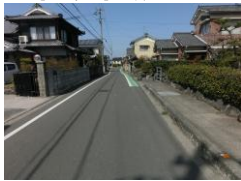
H29【NO. 1】 済