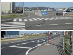
R3【NO. 1】 済

〔状況〕 見通しがよく、車の速度が上がりやすい場所、重と子供が接触しそになりました。