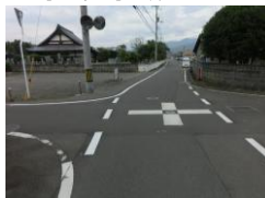
H29【NO. 2】 済