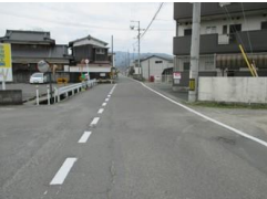
R7【NO. 3】 済

〔状況〕 県道と市道が複雑に交差し道幅が狭くなる上に歩道が無く、大型車両の通行もあり危険です。