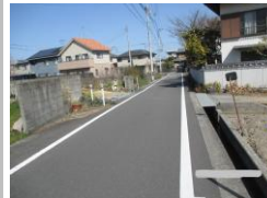
R3【NO. 101】 済