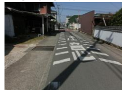
H29【NO. 4】 済

〔対策〕 交差点部分の路側帯を拡張して外側線を引き直しました。交差点マークを設置しました。