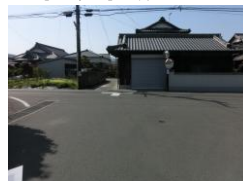
H29【NO. 3】 済

〔対策〕 ドット線を設置し、路側帯を拡張して外側線を引き直してカーブミラーを設置しました。