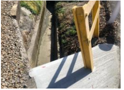
R3【NO. 1】 済

（状況） 下校時、児童が水路に落ちました。 （対策） ガードレール支柱から軌道敷部に床板を打って水路の一部に蓋をしました。