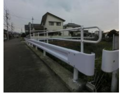
H30【NO. 1】 済

（状況） 橋の欄干が低く、川への転落の危険性があります。 （対策） ガードレールをつぎました。