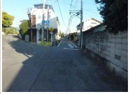
H29【NO. 5 H24-118】 済

（状況） 見通しの悪い複雑な交差点で、危険です。 （対策） 警視庁「通学路」の交換、外側線・止まれを引直しました。 カーブミラー設置の代替として、通学指導で対応しました。