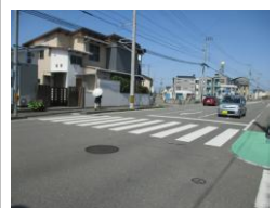
R3【NO. 105】 済

（状況） 信号を渡った後に踏切があり、電車が通るときに待っているところが道路のすぐ横になるため危険です。 （対策） 待機スペース（グリーン部分）を狭くしました。 横断歩道を引き直しました。