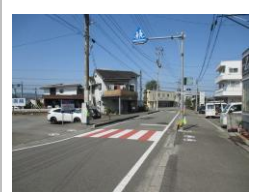
R3【NO. 103】 済

（状況） 朝・夕の交通量が多く、速度を出している車が多いです。 （対策） パトロールを実施し、横断歩道を引き直しました。