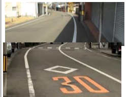
R3【NO. 102】 済

（状況） 道が狭く、速度を出している車が多いです。 （対策） パトロールの実施、30キロの路面標示の増設、外側線の引き直しをしました。