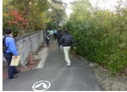
H29【NO. 1】 済

（状況） 細い道で薄暗く人の目が暗くいため、防犯面で不安があります。 （対策） 通学ルートを変更しました。