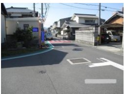
R3【NO. 101】 済

（状況） 道が狭く見通しが悪い上に、抜け道として利用する車が多く、スピードを出して走っています。 （対策） グリーンバウトと横断歩道を設置しました。