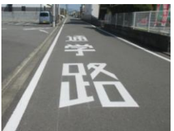
R7【NO. 1】 済

（状況） スピードを出す車が多く危険です。 （対策） 路面に通学路の標示を設置しました。