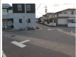
R3【NO. 104】 済

（状況） 車の通りが多く、見通しが悪いです。 （対策） 交差点マークを設置しました。