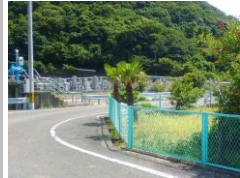
H29【NO. 4】 済

(状況) 直角に曲がるカーブで、公園の樹木が境界を越えているため、見通しが悪く危険です。 (対策) 公園の樹木を伐採しました。 コンクリート敷面に反射板を設置しました。