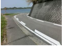
H29【NO. 1】 済

(状況) 山から海沿いへの下り坂で、道幅が狭いカーブです。 (対策) 減速マークを設置しました。