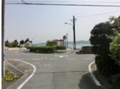
H29【NO. 2】 済

(状況) カーブミラーはあるが、劣化していて見えにくい状態です。 (対策) カーブミラーを交換しました。