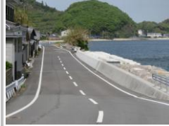
H29【NO. 5 H24-91】 済

(状況) 直角に曲がるカーブで、公園の樹木が境界を越えているため、見通しが悪く危険です。 (対策) 公園の樹木を伐採しました。 コンクリート敷面に反射板を設置しました。