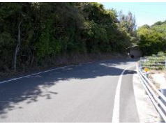
R3【NO. 101】 済

(状況) 道幅が狭く、狭い道の終わりから、中央線有りの上り坂のカーブにさしかかるので、対向車はスピードが出やすくなっています。 (対策) 道幅を確保するため除草を行いました。