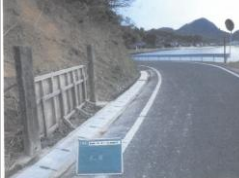
H29【NO. 3】 済

(状況) 一部、側溝に蓋がない箇所があり、歩行する空間が狭くなっており、注意が必要です。 (対策) 側溝蓋を設置しました。