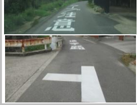
R7【NO. 1】 済

（状況）道幅が狭く、車がスピードを落とさずに走行して危険です。 （対策）路面に「通学路」と「カーブ注意」の標示、交差点マークを設置しました。