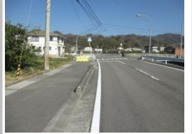
R3【NO. 101】 済

（状況）歩道が一部途切れており、路側帯のみになっています。 （対策）外周線を引き直し、その内側を歩くように指導しました。