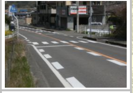
H29【NO. 1】 済

（状況）スピードを出して走る車が多く、横断する際に注意が必要です。 （対策）減速マーク・ドット線・横断線を設置しました。