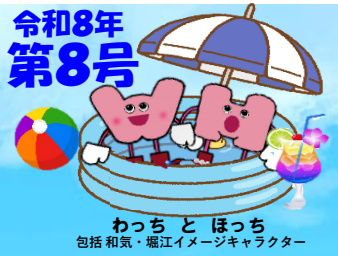
わっちとほっち 包括和気・堀江イメージキャラクター